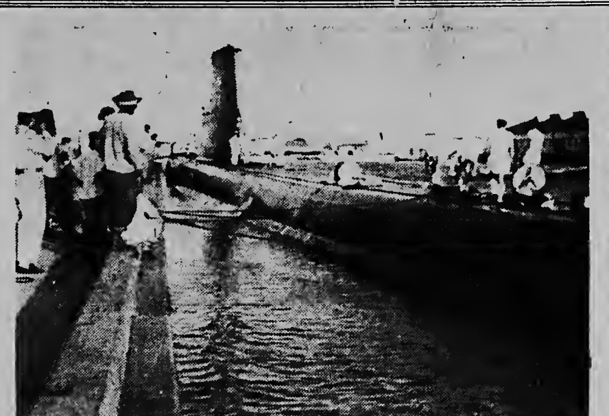
Ayera tardi como dos ora mas laat cu e tabata spera a yega den haaf di Oranjestad e submarino Hulandes Mr. Ms. 'Zeelceuw'. Aki nos ta mira e bapor den prome basin na momento cu nan ta marrando e. Awe mainta e ta sali atrobe pa e bolbe Diabierne pa un bishita cu lo dura henter e weekend. Sr. Sint, loods na Oranjestad, a trece e submarino aden.

Evita bagatela awe y tene e bista dirigi na e factornan solidu diradador den futuro. No vale la pena laga cosnan chiki molestioso. Segun dia ta bai pasando sin embargo e ta bira armonioso, ike ta bon pa negoshi, contactonan, retencion, y cierto cambianan necesario. Ideanan nobo, originu, lo bini den parti di anoch. Cambianan haci awor lo tin fainoso resultado. Keda reaktivo sin embargo na tur momento.